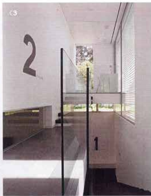
1-2: לופט בסן פרנסיסקו, קליפורניה 3: בית פרטי בתל אביב

"בהחלט. זאת תשוקה, לא עבודה. אני חיה את זה כבר הרבה שנים, לכן אני לא יכולה לתכנן משהו שאני לא מאמינה בו, ואני מרגישה תוך כדי עבודה אם הדברים נכונים או לא. לפעמים יש הסברים רציונליים ולפעמים לא".