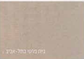
בית פרמי בתל-אביב