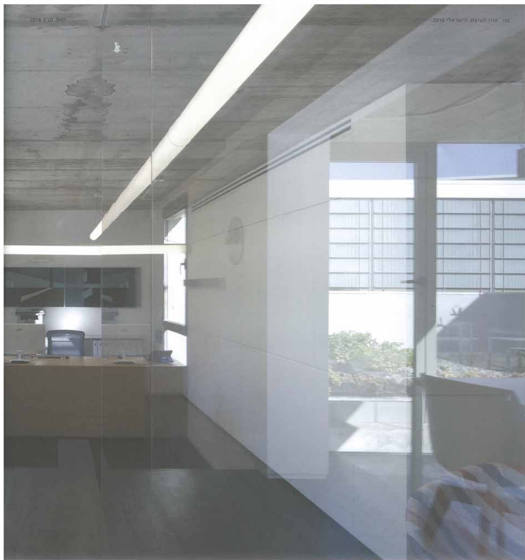
למעלה: סיטואציות אופקיות משתנות לאורך המפלסים