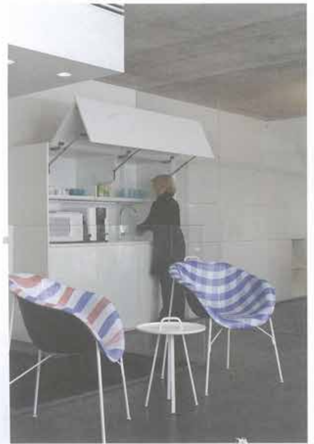
למעלה: חלל הישיבות המהווה אתגרתא מרחבית וויזואלית למטה: האלמנטים הפונקציונליים בחלל יוצרים תחושת ניקיון ודיוק בעמוד הקודם: חלל הישיבות- המברק המקשר בין החוץ למנים